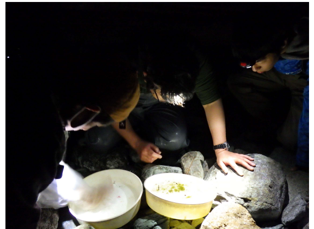
日没後もひたすら仔魚を数えます

西条の山間部の放置人工林問題は、加茂川の水量や西条の地下水の問題と繋がっています。山の木々を適正な状態に戻し、加茂川の水を守ることは、そこに生きる小さな魚たちをも守ることに繋がります。そして、地下水の利用者である私たちの暮らしを守ることにもなるのです。